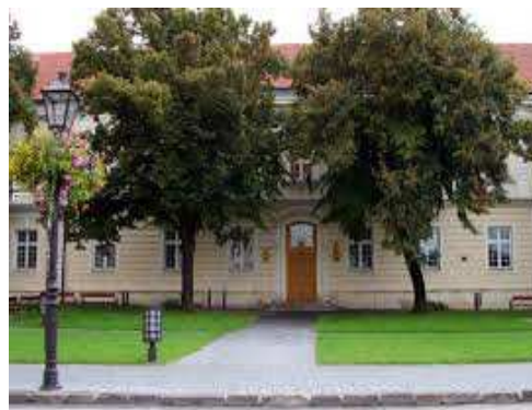
FZaSP TU, Univerzitné námestie 1, Trnava

AULA 1A1 , FILOZOFICKÁ FAKULTA, TRNAVSKÁ UNIVERZITA, Hornopotočná 23, Trnava