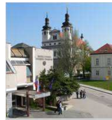
FF TU, Hornopotočná 23, Trnava